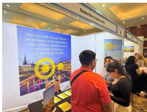
Presumtiva studenter får veta mer om SH:s utbildningsutbud i Mexiko.

Nyligen deltog IO i rekryteringsresor i Indien (Thiruvananthapuram, Chennai, Bengaluru, New Delhi och Aligarh) och Mexiko (Mexico City och Leon) för att möta presumtiva internationella studenter. Resan till Indien anordnades av svenska ambassaden och syftade även till att stärka samarbetet med lokala lärosäten. Genom att delta i evenemang tillsammans med andra svenska lärosäten fick IO informera om högskolans internationella utbildningar och visa fördelarna med att studera just hos oss. Mer information om rekryteringsevent finns på sh.se/meetus .