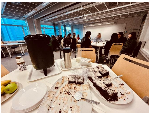
Studenter fikar och diskuterar sina utbyteserfarenheter under nätverksfika.

Den 7 november organiserade IO en nätverksfika för utresande och inresande studenter inom Erasmus+ och högskolans bilaterala avtal. Ett tjugotal studenter som gör sina utbyte vid högskolan under HT24, eller som ska på utbyten vid något av högskolans partnerlärosäten under VT25 deltog och delade med sig av sina utbyteserfarenheter. Även flera studenter som är intresserade av att söka utbyte i den kommande utlysningssomgången deltog i eventet.