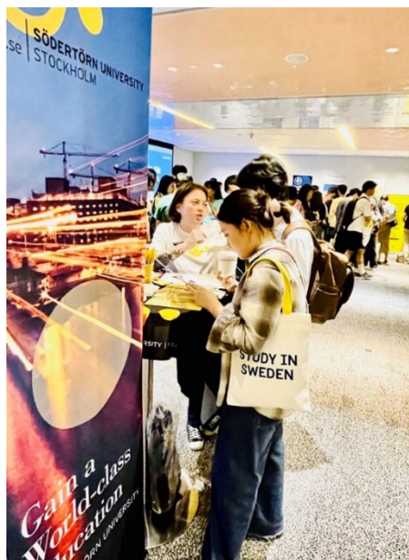
Mässa i Shanghai.

Information om kommande webinarier och event finns på: sh.se/meetus .