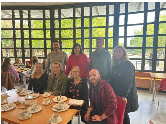
Personal på besök i Madrid.

Den 19–20 oktober gjorde Funka och kurator vid högskolan ett personalutbyte vid Universidad Carlos III i Madrid (UC3M). Under utbytet träffade och utväxlade gruppen erfarenheter med personal vid International Office, Disability Officer och en av UC3M psykologer, för att få en generell förståelse för funktionernas arbete med inresande och utresande utbytesstudenter.